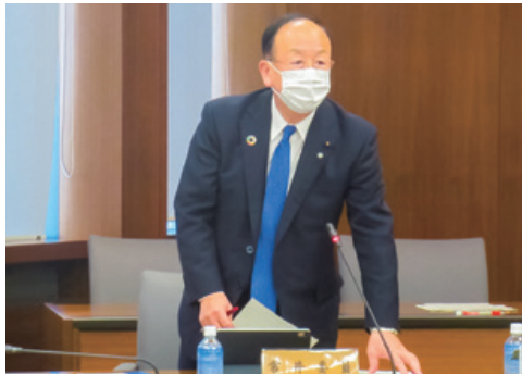
▲保健福祉医療委員会で県立中央病院の建て替えに向けた取り組みや子宮頸がんワクチンに関する質問をした。

キャッチアップ接種については、国で予算措置されるのが来年度になると考えており、その時にすぐに対応できる形を市町村と相談していきたい。また、副反応に対する相談体制を構築することも大切だと考えており、この点も含めしっかりとやっていきたい。