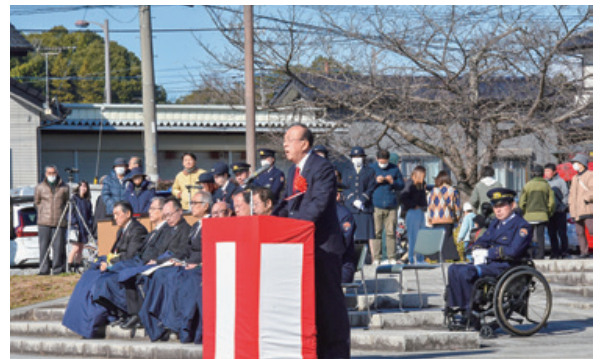
▲笠間市消防出初式は、能登半島地震の被災者に向けた黙祷で始まった。災害列島日本に住む我々は、消防団の皆様にも、地域防災の要として活動して頂いている。事故のないように活動してほしい。(R6年1月)