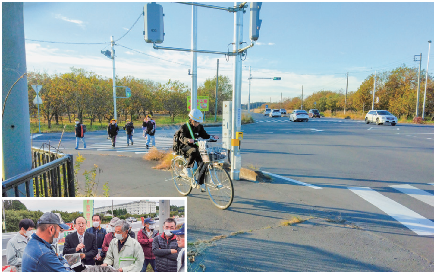
▲国道355号石岡岩間バイパスの福島地区内の交差点にやっと信号が設置されました。令和2年10月に地元の皆さんから、子どもの通学安全確保のために要望されていたものです(写真左下)。皆さんの熱意を基に、私は文教警察委員会などで再三にわたって必要性を訴えてきました。多くの区民の皆さんが喜んでいました。県土木部、県警察、市の関係者に感謝します。(令和5年11月)

発行者：常井洋治 〒319-0205 笠間市押辺1745 TEL.0299-45-6818 FAX.0299-45-0818