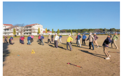
▲北川根地区グラウンドゴルフ大会も4年ぶりに開催。参加者の皆さんとラジオ体操を一緒にを行い、始球式でホールインワンを狙ったがだめだった。難しい。(R5年11月)

HPアドレス● http://business2.plala.or.jp/tokoiy をぜひご覧ください。フェイスブックもどうぞご覧ください。皆様のご意見をお待ちしています。