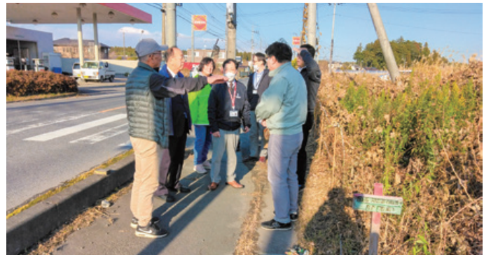
▲岩間一小の通学路予定地の進捗を心配した交通安全協会や交通安全母の会、PTA役員さんと県・市の担当者が、現場で一堂に会して協議した。(R5年12月)