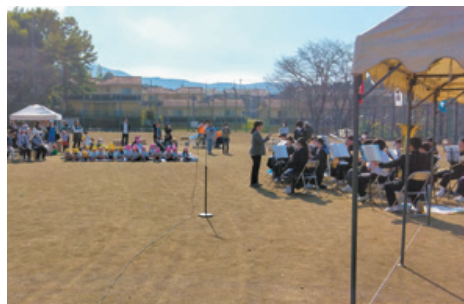
▲福原地区では、100回目の運動会が行われた。大正時代から先人たちが続けてきた熱意、ふるさとへの愛情に敬服した。稲田中の吹奏楽部の演奏を聴いたり、競技したり、楽しいひとときを送っていた。(R5年11月)