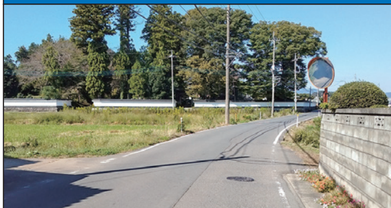
現在の交差点付近の様子