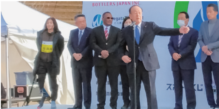
▲第18回かさま陶芸の里ハーフマラソン大会には、1,600人を超えるランナーが参加した。ホストタウンとなっているエチオピアの大使や、東京パラトライアスロンの谷真海選手らと開会式にて。会場には、エチオピアにシューズやTシャツを贈る回収ボックスも設置された(R5年12月)