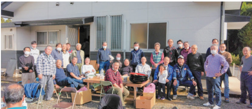
▲4年ぶりに開催された福島区のそば会で皆さんと。多くの区民の皆さんと地域の課題について話し合える貴重な場になっている。(R5年11月)