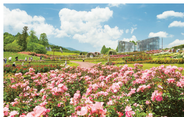
▲県フラワーパークをリニューアル

の生き物の生態等の展示により、水族館を夜型観光の牽引役に 拡 アクアワールド茨城県大洗水族館魅力向上事業 700百万円