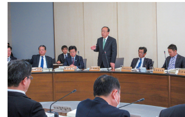
▲委員会では、新人議員も活発に質問し、緊張感があった。（H31年3月）

村上総務部長 知事は、新しい茨城づくりに向けて高い志をもっており、職員に対しても、職務に対する要求水準が相応の場合や、物事を決める際、ボトムアップによる丁寧なやり方もあるが、トップダウンによる決断が有効な場合もある。 職員も、知事とフリーディスカッション等の議論を経て、新しい茨城づくりに向けた政策形成を懸命に頑張っているところである。知事・副知事・部課長が丸一となって、「活力があり、県民が日本一幸せな県」づくりに向けて、挑戦する県庁への変革に取り組んでいく。