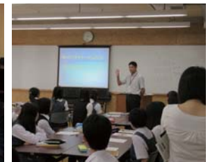
▲がん対策条例プロジェクトチームは、水戸二高でのがん教育の授業を視察。いばらき自民党の21人の県議が参加した。(H27年7月)