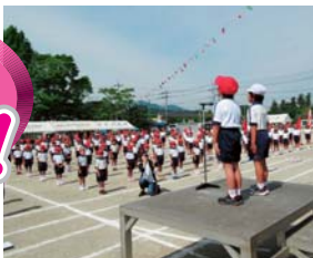
▲穴戸小学校の運動会では、伝統校らしくきびきびした競技が繰り広げられた。開会の言葉を述べる1年生。(H27年5月)