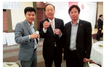
▲ベトナムと茨城県の交流に尽力されたドアン・ファン・フン大使の送別会にて、若い国をリードするエリート外交官たちと歓談。(H27年6月)