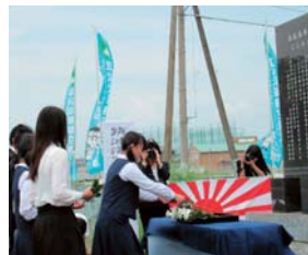
▲筑波海軍航空隊の17回目の慰霊祭では、私が提案してきた地元の小・中学校4校の代表の参列が初めて実現。平和への願いを次代へ継いでいきたい。(H27年5月)