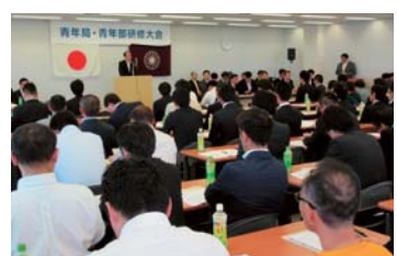
▲自民党県連青年局の大会で、県連役員を代表してあいさつ。自民党を支える青年局の活動に頼もしさを感じた。(H27年6月)