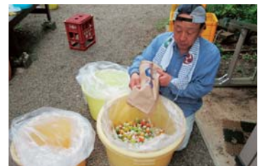
▲4年ぶりに梅干しづくりに挑戦。妻のレシピと監修に忠実に南高梅50kgを仕込んだ。(H27年6月)