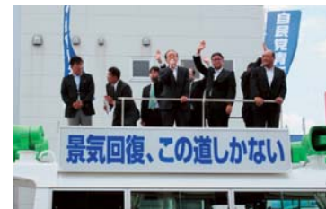
▲いばらき自民党青年局の街頭遊説に政調会長として参加。若手議員の行動力はすばらしい。(H27年6月)