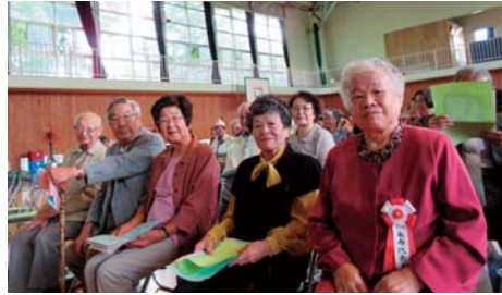
▲友部小学校校区の敬老会で、米寿のお祝いを受けた皆さん。(H26年9月)