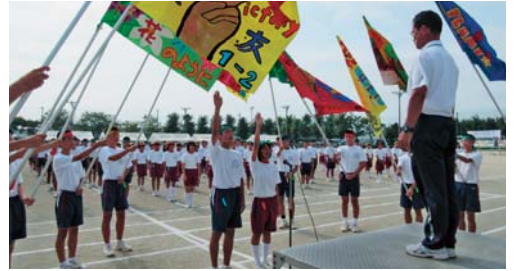
▲各中学校の運動会は、さわやかな選手宣誓で始まった。(H26年8月)