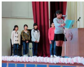
▲宍戸小の「三世代ふれあいの集い」で、生徒の皆さんが、モチ米やさつま芋の栽培に協力してくれた方々にお礼を述べた。(H26年10月)