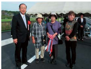
▲国道355号笠間バイパスの一部(下市毛地区900m)開通式にて参加者の皆さんと。総延長5.2kmのうち残り間1.3kmの早期開通にがんばります。(H26年10月)