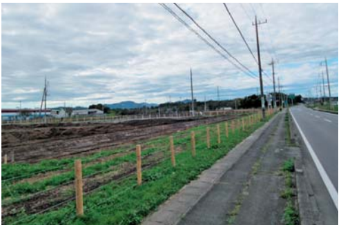
▲整地された2haのモデル区画。上方は、常磐道上り線の友部SA。(H26年10月)