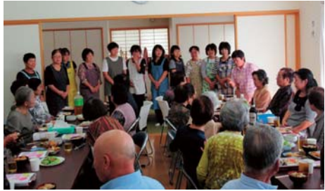
▲下安居地区敬老会では、女性の皆さんがすべて手作りのお弁当をつくってお祝いをした。(H26年9月)