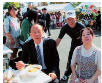
▲県立友部高校の「友葵(ゆうぎ)祭」は大にぎわい。ラーメンを食べながら、PTAの役員の皆さんと。(H26年10月)