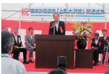
▲友部IC〜宍戸小裏〜大沢跨線橋の都市計画道路上町大沢線が開通。宍戸小のプラスバンドの皆さんが華を添えてくれた。(25年7月)