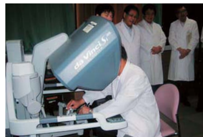
▲私もダヴィンチを模擬操作してみた（写真）が、操作はなかなか難しい。多くの命が救われることを願う。（25年7月）

前立腺がんや、婦人科の手術などに有用な手術支援ロボット「ダヴィンチ」が、中央病院に導入されました。現在は、操作に熟練するために研修を行っており、9月から稼働する予定です。写真の機器が2台導入され、2人の術者が手術中に共同作業することもできます。