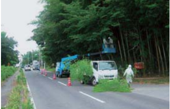
▲柏井地区入口の県道城里石岡線にかかる竹木の伐採の依頼があり、早速対応した。(25年7月)