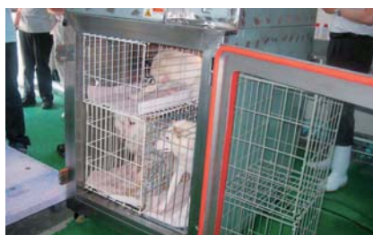
▲現在炭酸ガスによる殺処分を行っているが、犬に苦痛を与えているとの指摘がある。私は、吸入麻酔薬で眠らせてから殺処分する方法の試験に立ち合った。(25年7月)