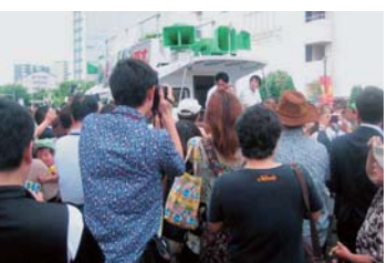
▲参院選の応援につくば市に入った小泉進次郎自民党青年局長の演説は絶妙だった。聴衆の中には笠間市の人。(25年7月)