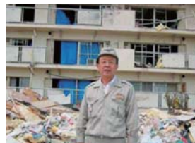
▲つくば市北条の雇用促進住宅は竜巻の直撃を受け、窓ガラスがすべて吹き飛び、瓦礫の散乱もひどかった。