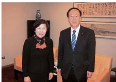
▲東日本大震災で日本は台湾から約230億円の義捐金や大量の飲料水をいただいた。そのお礼を兼ねて、いばらき自民党議員団が台湾を訪問。国立故宮博物院の周院長(写真)に本県での特別展を要望した。(24年4月)