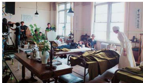
▲県立こころの医療センター内にある同航空隊本部棟だった建物(旧院長室)で東宝映画「永遠の0(ゼロ)」の撮影が行われた。特攻で散った祖父の生きざまをたどる若者の物語。原作は百田尚樹。監督は山崎貴(「ALWAYS 三丁目の夕日」ほか)。V6岡田准一主演。平成25年以降公開予定。茨城県フィルムコミッションが撮影協力。(24年6月)