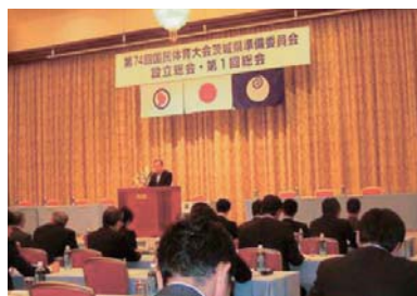
▲7年後の2019年(平成31年)の茨城国体の準備会が発足した。笠間市は相撲とゴルフ競技開催を希望している。私は席上、合気道をデモンストレーションスポーツとして採用するよう申し入れた。(24年5月)