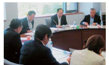
▲座長代理として定数についての座長案を説明(24年6月)