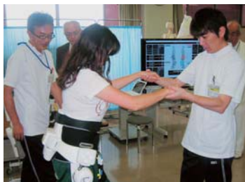
▲保健福祉委員会で県立医療大学でのロボットスーツの開発状況を調査。(24年6月)