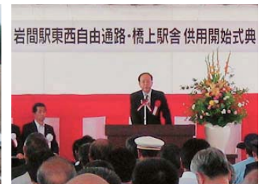
▲岩間駅東西自由通路と橋上駅舎供用開始式典。通路の愛称は「あいろーど」。IWAMAの、合気道の「あい」、愛の「あい」をイメージ(24年7月)