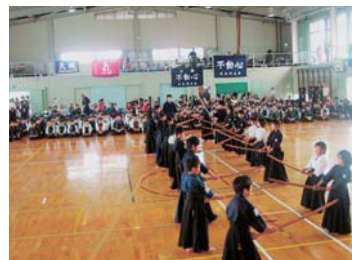
▲笠間地区剣道連盟の親善合同稽古会での模範演武。礼に始まり礼に終わる所作はすばらしい。(24年6月)