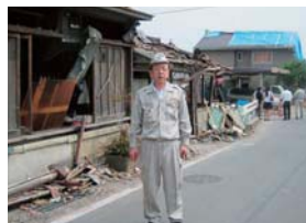
▲つくば市北条地区では、竜巻により軒並み住宅損壊の被害が発生した。