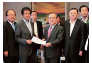
▲いばらき自民党の政調会筆頭副会長として、知事に対策を要望。