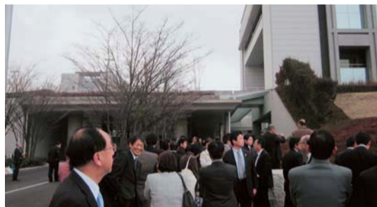
▲議員、職員らは外に避難したが、余震が続き、議事堂の外壁の一部が損壊する様子を見た。(23年3月11日15時25分)