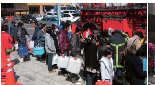
▲停電と水道の断水のため、飲み水やトイレの水を求めて消防署の給水車には、静かな長い行列ができた。笠間公民館にて。(23年3月12日11時01分)