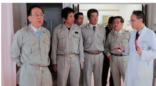
▲「災害拠点病院」として期待された県立中央病院も自ら被災して、十分な機能を発揮できなかったのは、とても残念だった。