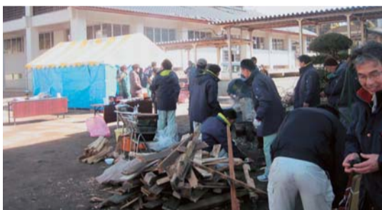
▲笠間市職員の皆さんは、自宅の被災を顧みず、避難住民のために、不眠不休で働いてくれた。友部中学校にて。(23年3月12日10時39分)