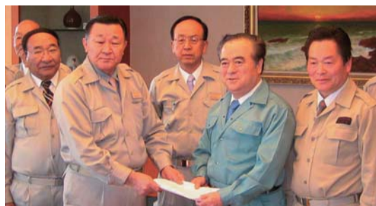
▲いばらき自民党県議45人が被災状況を調査した結果を踏まえて、知事に早期復旧の予算化を要請。