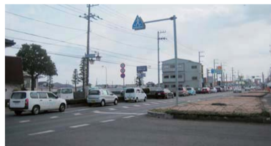
▲ガソリン、灯油の不足が続く、市民生活は不安にさらされた。ガソリンスタンド前の行列。(23年3月17日)