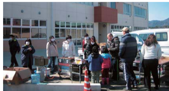
▲笠間市赤十字奉仕団などボランティアの皆さんによる炊き出しは、避難住民の心をなごませてくれた。岩間中学校にて。(23年3月12日10時14分)