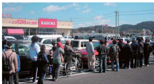
▲停電のため、店を開けた数少ないスーパーには、食料や水を求めて長蛇の列ができた。(23年3月12日11時18分)