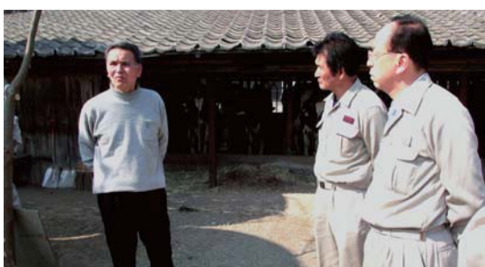
▲酪農家は、福島第一原発事故の放射性物質による原乳の出荷規制で、毎日搾った原乳を廃棄処分していた。