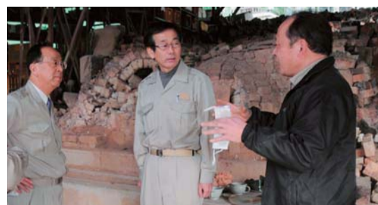
▲笠間焼は、のぼり窯や陶器の損壊でダメージを受けたが、地場産業として、皆さんと協力して復興させたい。