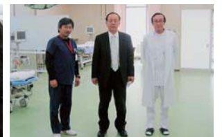
▲救急センター入口で、担当医師と一緒に。(23年1月)