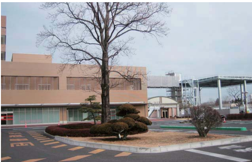
▲竣工した救急センター(1F)、循環器センター(2F)の全景。ヘリポート(右端)から患者は3F部分へ搬送される。(23年1月)