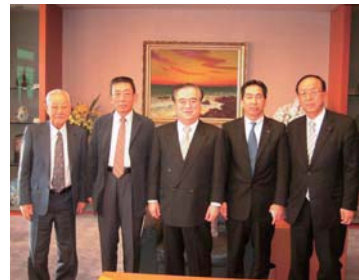
▲畜産試験場跡地へ「大学誘致を進める会」の皆さんと、橋本知事に医科大学の誘致を要望。(22年12月)