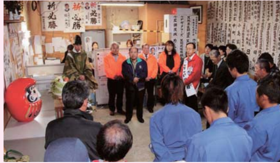
▲選挙の初日に必勝祈願祭を執り行った。新人のときと同じような緊張感でいっぱいだった。