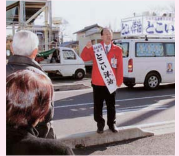
▲なま声でも有権者に訴え、声はかれました。街頭演説は、70回を超えた。