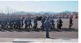
▲消防団は地域の安心の要。600人の団員による出初式は、勇壮で、とても頼もしく感じた。(23年1月)