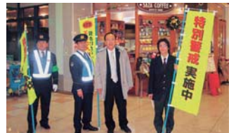
▲笠間警察署の年末パトロールには、笠間高校の生徒も参加した。(22年12月)