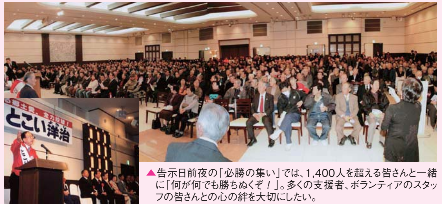
▲告示日前夜の「必勝の集い」では、1,400人を超える皆さんと一緒に「何が何でも勝ちぬくぞ!」。多くの支援者、ボランティアのスタッフの皆さんとの心の絆を大切にしたい。