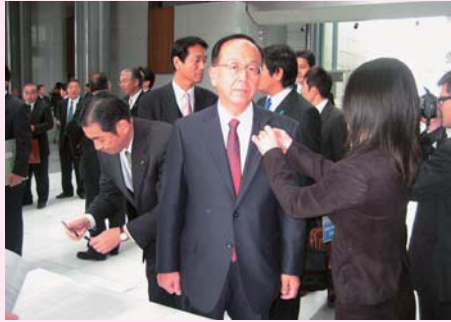
▲初登庁日は、一番乗りで議員バッジの交付を受けた。4期の重みと責任をずっしりと感じた。