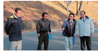
▲大橋地区の東小学校近くの道路整備で、水戸土木事務所の課長らと現地調査。(22年12月)