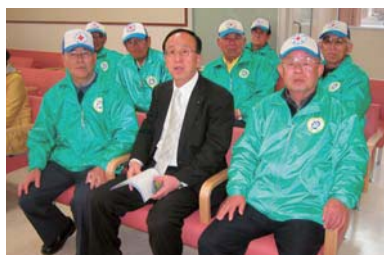
▲救急センターの待合室は、広くて暖かい。内覧会見学の皆さんと。(23年1月)