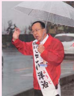
▲告示日の朝、大雨の中必死に訴える。