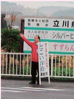
▲道路で早朝の辻立ち。たくさんの人に励ましを頂いた。