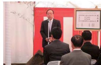
▲JR岩間駅の橋上化、自由通路の安全祈願祭にて。総工費11億円で、24年春オープン予定。(23年2月)