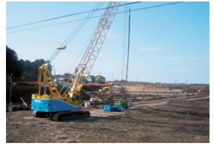
▲現地では調整池と枝折川改修の工事が進む

また、直売センターの設置については、進出意欲のある事業者があれば、候補地の一つになるのではないかと。