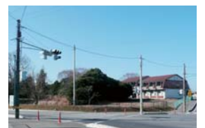
▲公園（広場）として開放される跡地

また、公園としての暫定利活用については、市と十分協議しながら検討していく。（検討結果は、1ページ参照）