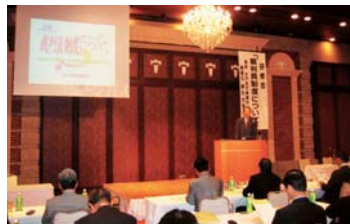
▲自民党議員会では、水戸地方検察庁の勝丸充啓検事正を講師に招いて、21年5月21日から始まる裁判員制度の研修会を開催した。(20年5月)