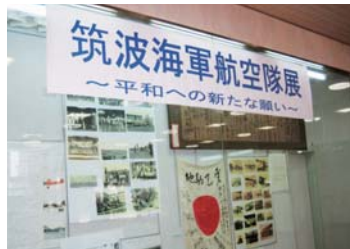
▲現在の県立友部病院は、筑波海軍航空隊の跡地である。同隊員55人が沖縄戦に特攻出撃し、散華した。友部公民館で貴重な資料が展示された。(19年8月)