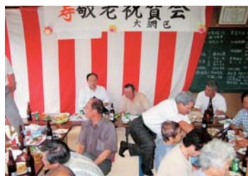
▲大網(だいあみ)区の敬老会は、いつも女性の皆さんの心のごもった手料理でもてなしている。和気あいあとした雰囲気の中で、お年寄り、なごやかなひと時を過ごした。(19年9月)