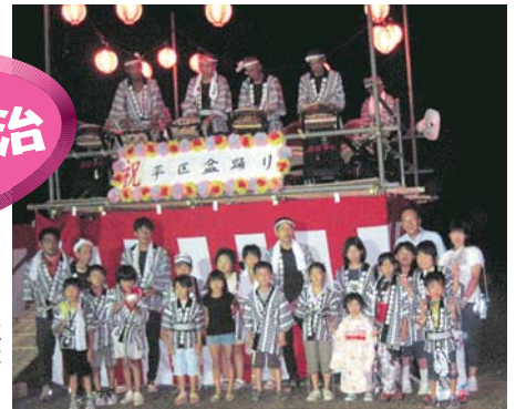
▶ 平区では、県のコミュニティ助成金で、太鼓・はっぴなどを揃え、初めての盆踊りを実施した。子どもたちは、とても嬉しそうだった。(19年8月)