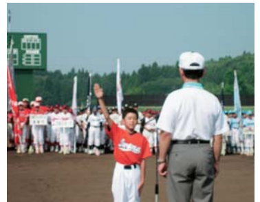
▲県スポーツ少年団野球大会で、元気に選手宣誓。笠間市民球場にて。(19年7月)