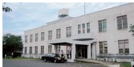
◀筑波海軍航空隊の本拠地であった、築73年になる友部病院正面玄関。