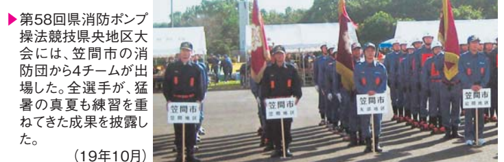
▶ 第58回県消防ポンプ操法競技県央地区大会には、笠間市の消防団から4チームが出場した。全選手が、猛暑の真夏も練習を重ねてきた成果を披露した。(19年10月)