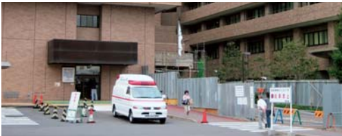
◀中央病院では、救急患者受け入れのため、処置室を増設工事中。