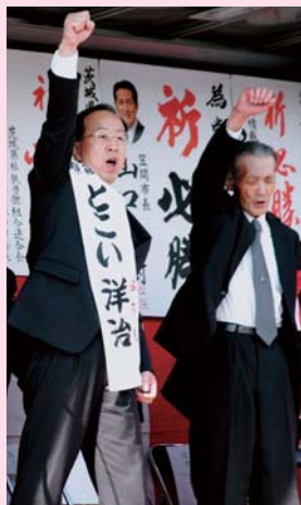
▲ 天を突くような「がんばろう三唱」。(隣は、塙後援会長)

平成18年12月1日に告示された県議会議員選挙の出陣式には、大勢の皆様にご出席頂き、盛会に開催できました。多くのご来賓並びに推薦団体の代表、そして出席者の皆様から心温まる激励のお言葉を頂きました。