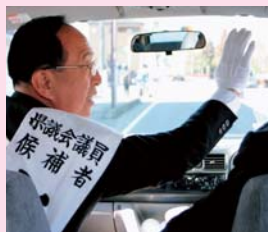
▲ 遊説車の中からも、沿道の皆さんに応えてちぎれるほど手を振る常井候補。告示日1日だけの遊説だったが、暗くなっても続いた。