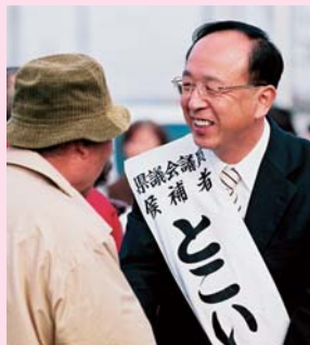
▲ 出陣式会場や遊説先で一人ひとりの皆さんと握手、握手。