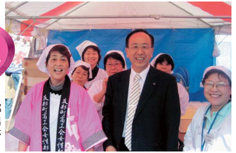
▲ふるさと友部まつりでは、友部商工会女性部の皆さんの出店が素敵で笑顔と元気の良さにぎわった。(18年10月)