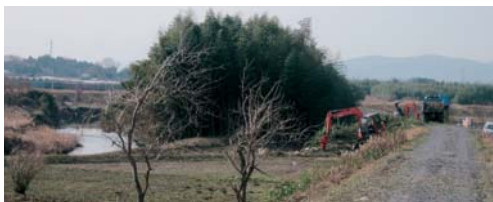
▲涸沼川に繁茂した竹木の伐採が進んでいる。地元の要望を受け、湯崎、仁古田、下押辺地区で同時に実施している。(19年1月)