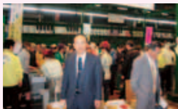
▲東京都大田市場内にて(18年5月)

〔答弁〕 コンビ尼のおにぎり・お弁当には、県産コシヒカリは、約9000トン(流通している県産コシヒカリの約1割に相当)使用されている。「農」を中心とした循環型地域経済はもっともいいシステムなので、これから大いに取り組んでいく。