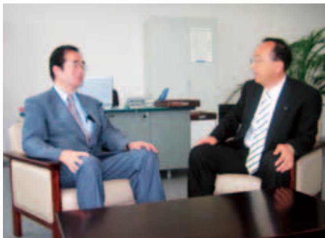
古田管理者(左)と対談する常井議員