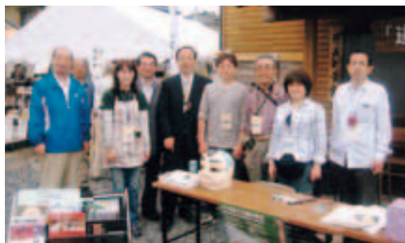
▲笠間市弁天町で開催された「道の市」でスタッフの皆さんと。新市を区割りとする県議選は、4年後になる。(18年6月)

私の会派では、これまで法律の基本通りに合併後の新市の区割りで実施すべきだと主張してきましたが、①議員定数の改正条例の議員提案説明で、「次回改選の2010年12月の選挙では、区割り・定数の抜本的な改正を行いた