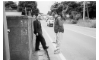
▲国道355号線の岩間町市野谷地区(コメリ近辺)で、道路際に段差があり、自転車や歩行者が危険との連絡を受け、早速現地調査をした。この路線の全面的な路面整備と併せて、水戸土木事務所へ補修工事を依頼し、直ちに補修が実行された。(平成14年6月)